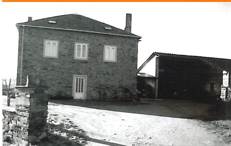
Sede da Fundación O Noso Lar