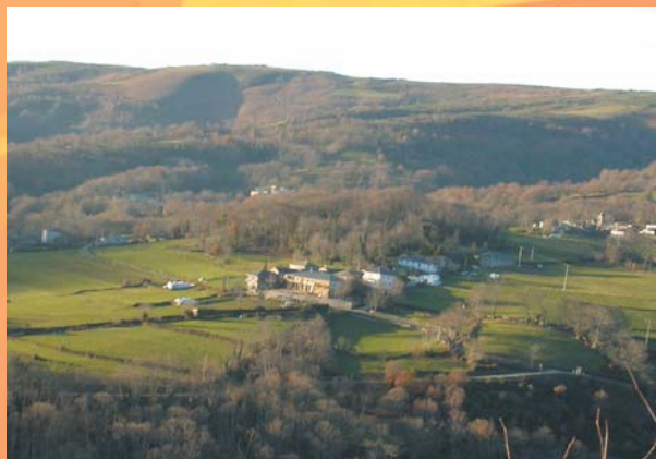
Vista panorámica de Campos

Esta privilexiada área, polo seu encanto e interese natural, é lugar axeitado para os amantes da natureza, pois propicia a meditación, é fonte de inspiración para poetas –Fiz Vergara foi natural destas terras– e gozo para os camiñantes que desexen descubrir novas e impresionantes panorámicas. E a todos eles, o río co seu son e os paxaros cos seus rechouchíos, agasállos decontino cun envolvente e marabilloso concerto.