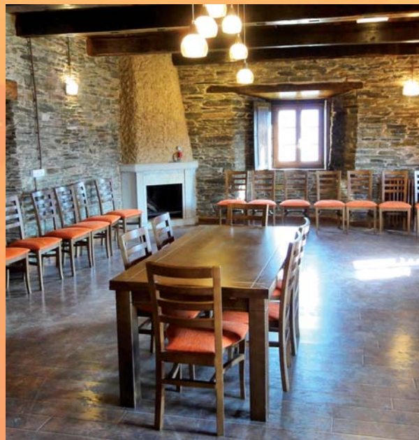
Salón Val de Lóuzara

Despois da exclaustación e coa desamortización (1835), o edificio do Priorato pasou a funcionar como casa reitoral onde vivían os curas que atendían pastoralmente estas parroquias. Desde o ano 1999, é a Fundación O NOSO LAR a encargada da súa xestión.