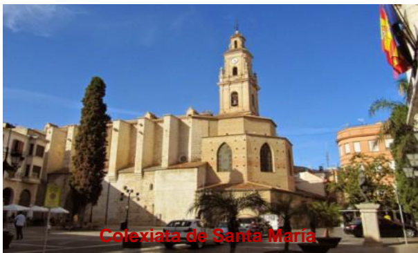
Colexiata de Santa María

Gandía: É un dos principais destinos turísticos dos españois. O seu casco histórico coa Colexiata de Santa María e o Palacio de Ducal (casa natalicia de San Francisco de Borja) fan dela unha cidade atractiva e chea de historia.