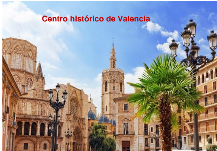
Centro histórico de Valencia

Valencia: unha cidade moderna, cosmopolita e dinámica. Un dos seus atractivos con personalidade propia é o seu casco monumental: as tres prazas: a da Almoina, a da Virxe e a da Reina; a Catedral e a Torre do Miguelete, as Torres e os Palacios, A Lonja e o Mercado Central... A Cidade das Artes e das Ciencias é outro dos atractivos de Valencia. O seu Oceanográfico é o maior acuario de Europa, e nel represéntanse os principais ecosistemas mariños do planeta.